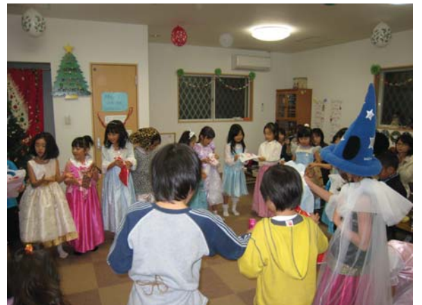
クリスマス・プレゼント交換