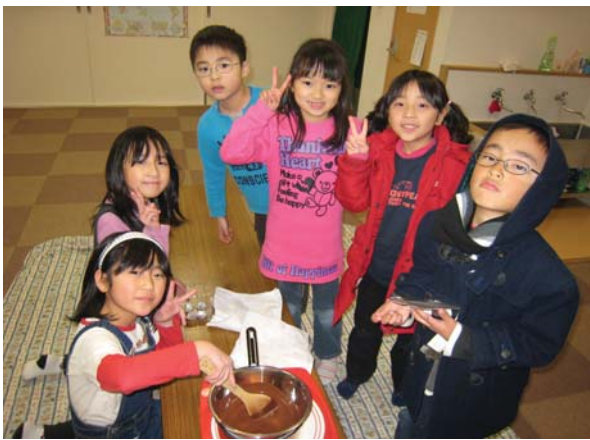
バレンタインチョコ作り