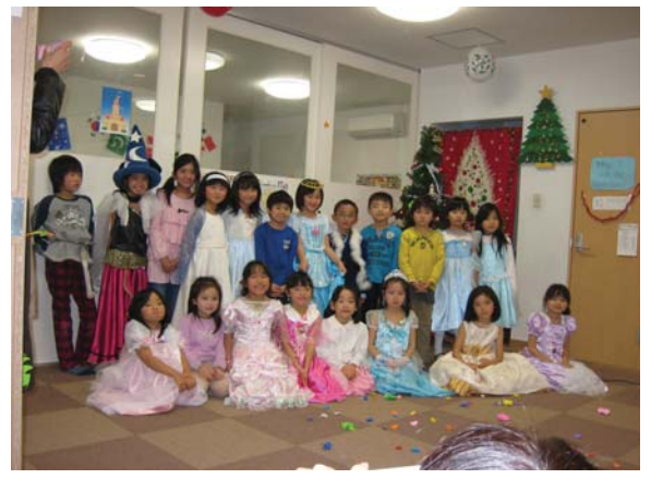
クリスマスパーティー英語劇