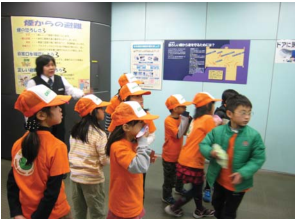
防災館社会科見学

年間の多くのイベントも英語を多く取り入れて楽しんでいます。12月のクリスマスパーティーや3月の学年修了会前には、1-2か月前から英語劇の練習や大道具の準備を毎日コツコツ始めます。夏休みなどの長期休暇中には、工場見学やプールなど遠出もしていろいろな体験ができるようにしています。